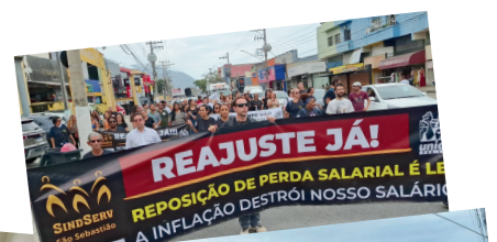
13.ABRIL. REUNIÃO COM PREFEITO, ONDE FOI APRESENTADA CONTRAPROPOSTA