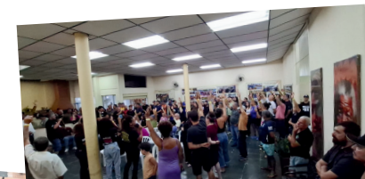
15.ABRIL. ASSEMBLEIA NA SEDE CENTRAL APROVA CONTRAPROPOSTA DA PREFEITURA.