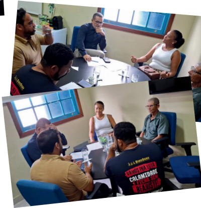
10.ABRIL. PARALISAÇÃO! PERCORREMOS AS PRINCIPAIS RUAS DO CENTRO PARA MOSTRAR À POPULAÇÃO A SITUAÇÃO DO SERVIDOR PÚBLICO E COBRAR DA PREFEITURA ATENÇÃO A NOSSA PAUTA.

SÓ COM A MOBILIZAÇÃO DOS SERVIDORES CONSEGUIMOS QUE NOSSO REAJUSTE FOSSE DISCUTIDO E EFETIVADO!