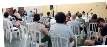
25.MARÇO. REUNIÃO COM CHEFE DE GABINETE. SEM CONTRAPROPOSTA.