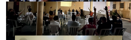
FEVEREIRO. ASSEMBLEIAS NA ENSEADA, EM BOIÇUCANGA E NO CENTRO PARA DEFINIRMOS NOSSAS PAUTAS DE REIVINDICAÇÕES!